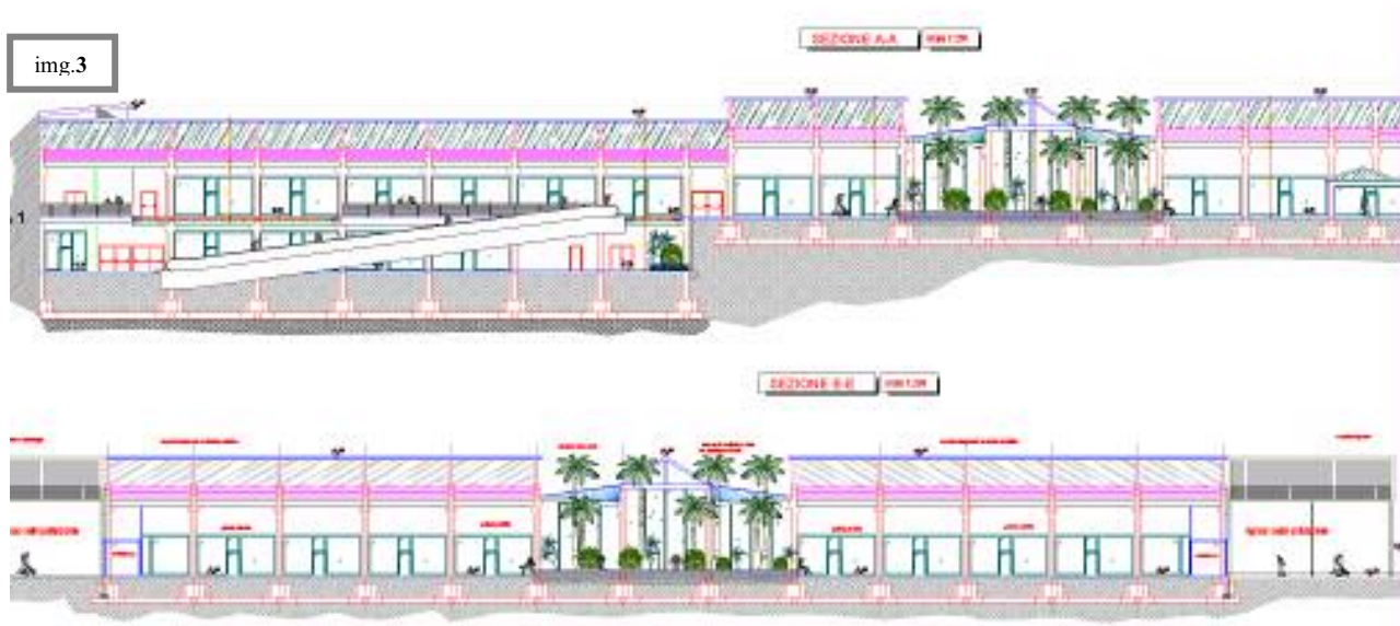
Image 1 – Mall entry – frontal view. Image 2 – Cooling and heating plant – Flow diagram Image 3 – Multiplex theatre and mall general sections

Immagine 1 – Vista frontale dell'ingresso al centro commerciale. Immagine 2 – Schema funzionale della centrale termofrigorifera. Immagine 3 – Sezioni generali del cinema multisala con annesso centro commerciale